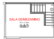
PLANTA BAIXA - MEZANINO Esc.... 1/100